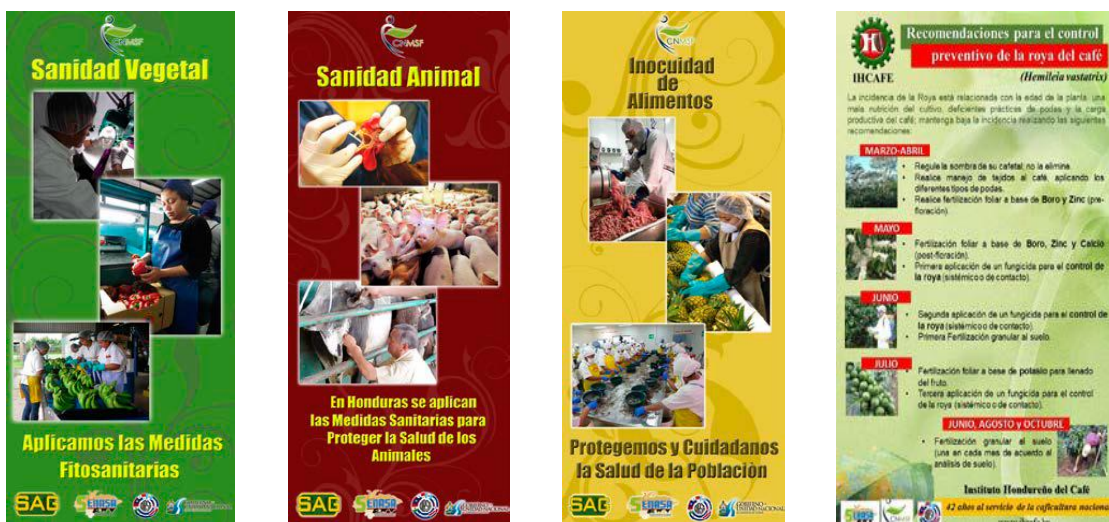
Banner y Fichas Técnicas