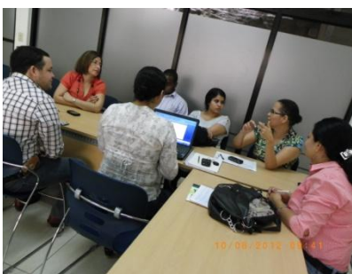
Talleres para elaborar la Propuesta