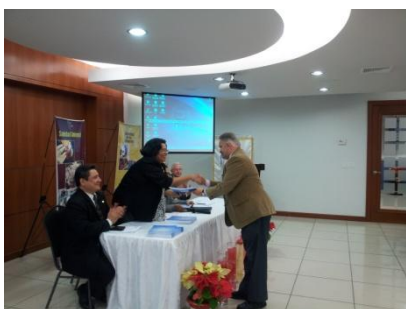
Entrega de la Propuesta a los Rectores

Posiblemente este sea uno de los productos más valiosos que dejó el proyecto y que tiene altas posibilidades de materializarse. Mediante un procedimiento altamente participativo de las universidades, se llevaron a cabo jornadas de trabajo que permitieron elaborar: “Diagnóstico sobre la inclusión de las MSF dentro del currículo de carreras universitarias a nivel de pregrado en Honduras” y la “Propuesta de reforma para la inclusión del tema sobre la aplicación de medidas sanitarias y fitosanitarias (MSF) en los planes de estudios de carreras universitarias a nivel de pregrado en Honduras”.