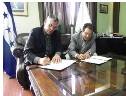
Firma de Convenios de Cooperación con medios de prensa