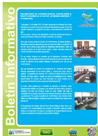
Publicación de “Umbrales” y Boletines Informativos