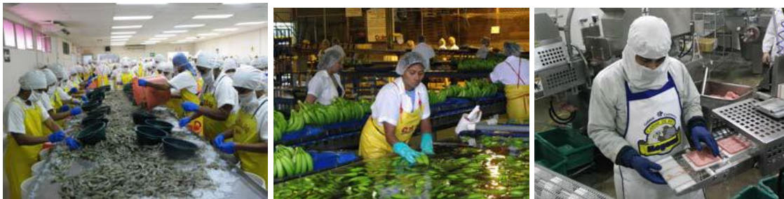
Documentando el cumplimiento de las MSF por las Agrocadenas