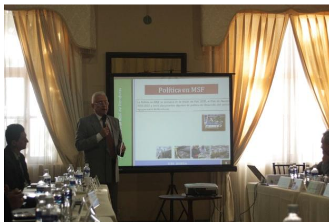
Presentación de la Política ante tomadores de decisión

La política fue ampliamente difundida y fue un instrumento valioso para dar a conocer a tomadores de decisiones como: Secretaría de Finanzas, Dirección de Competitividad/Secretaría de Planificación, Consejo Nacional de Competitividad y Congreso de la República.