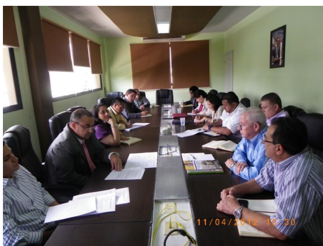
Reunión del Comité en pleno

A partir de la ejecución del proyecto, el CNMSF sesionó de manera regular, de cada reunión se preparó Ayuda Memoria que se circuló entre sus miembros y se dio seguimiento a los acuerdos y decisiones emanados del mismo. Puede afirmarse que esta actividad se cumplió.