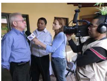
Cobertura de los medios de prensa en las diferentes actividades del proyecto