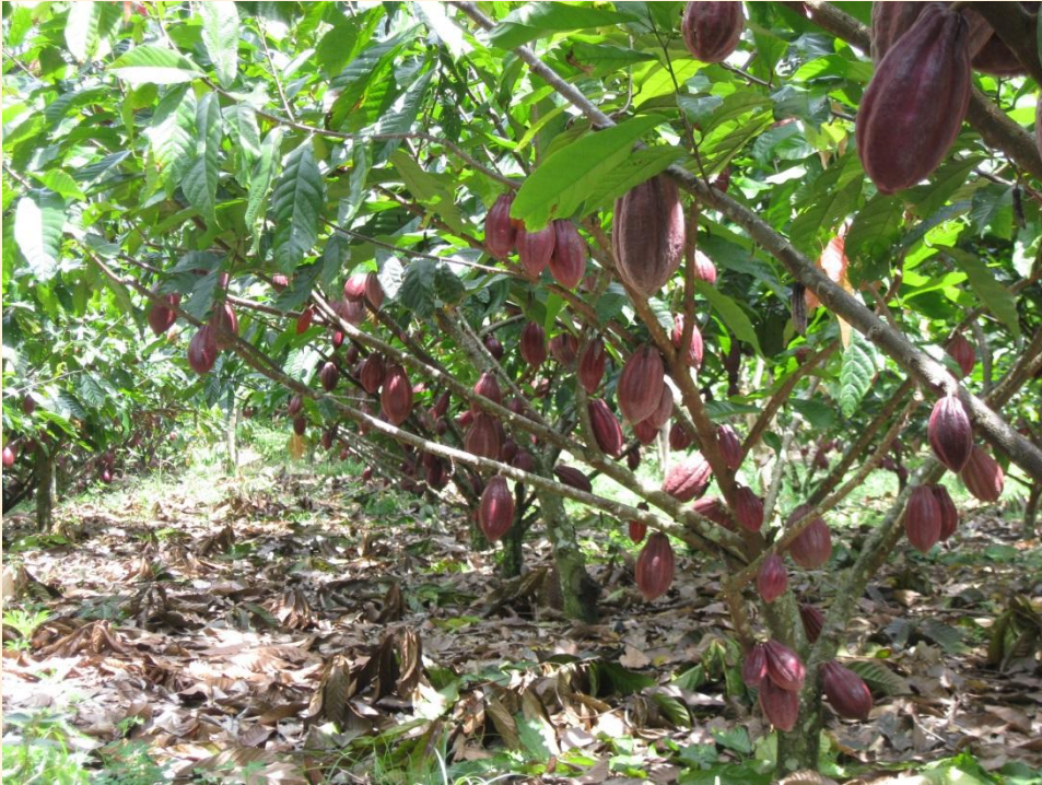
PERTANAMAN KAKAO KLONAL BIBIT HASIL SAMBUNG PUCUK