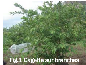
Fig.1 Cagette sur branches