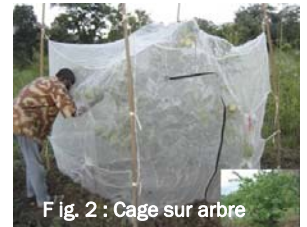
Fig. 2 : Cage sur arbre