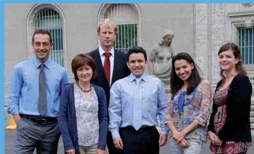
Equipo del FANFC

Volumen 3, Número 3/Octubre de 2010/ISSN 1999-4389